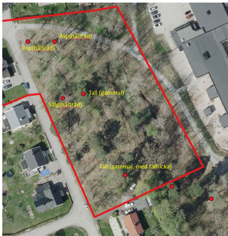
Figur 3. De fem skyddsvärda träden som påträffades inom planområdet vid fältbesöket 2022-05-02.

Enligt i planansökan presenterad skiss ska bebyggelse (flervåningshus) tillkomma i norra och västra delen av skogskullen, vilket innebär att sälgen och förmodligen båda asparna måste avverkas. Tallarna skulle förmodligen kunna bli kvar men de riskerar ändå att påverkas negativt, genom beskuggning från husen. Med hänsyn till den lilla skogsbackens ekologiska och sociala naturvärden vore det att föredra att inte bebygga skogskulen utan låta den vara kvar i sin helhet, i egenskap av centralt belägen tätortsnatur.