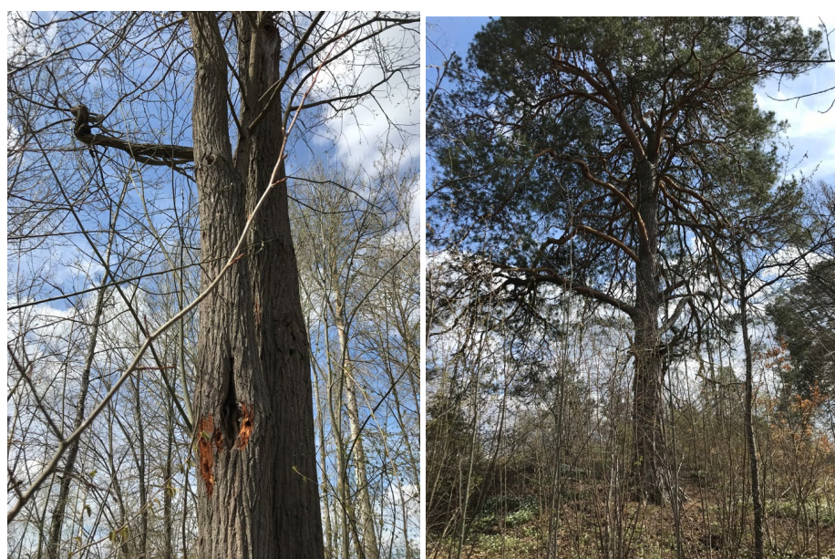
Figur 4. Foton från planområdet (2022-05-02). T.v. sälgen, t.h. en av de gamla tallarna.