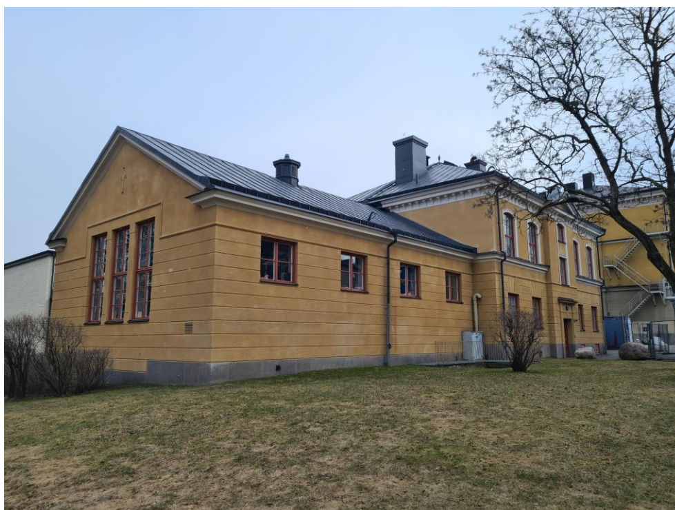
Figur 4: 1924 års gymnastiksal med fasad mot Djäkneparksskolan.