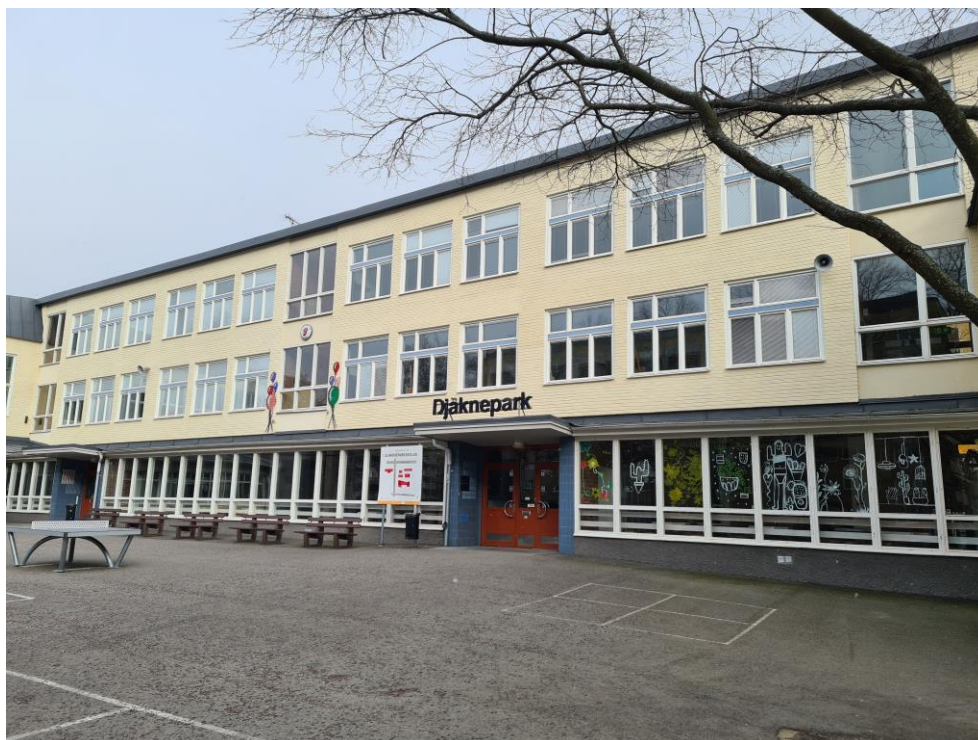
Figur 5: Djäkneparksskolan med fasad mot Prästgatan.