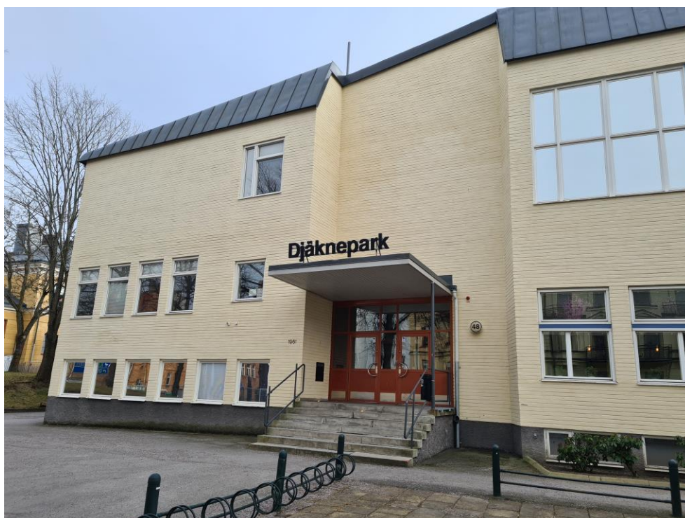
Figur 6: Djäkneparksskolans sidoentré på norra flygeln.