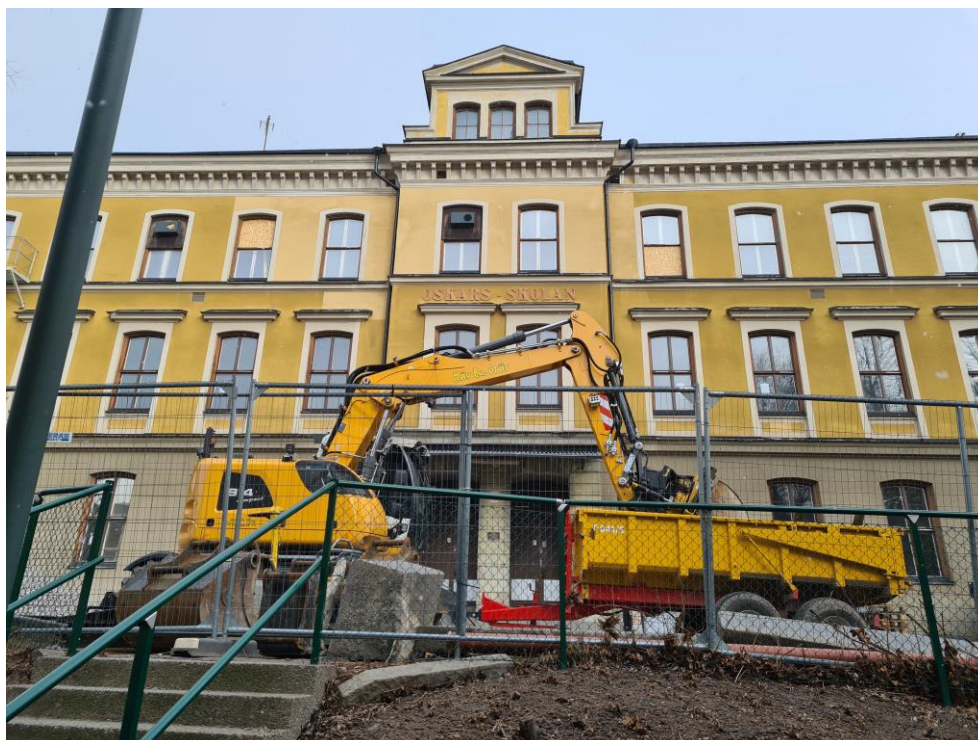
Figur 3: Oskarsskolan med fasad mot Djäkneparksskolan.