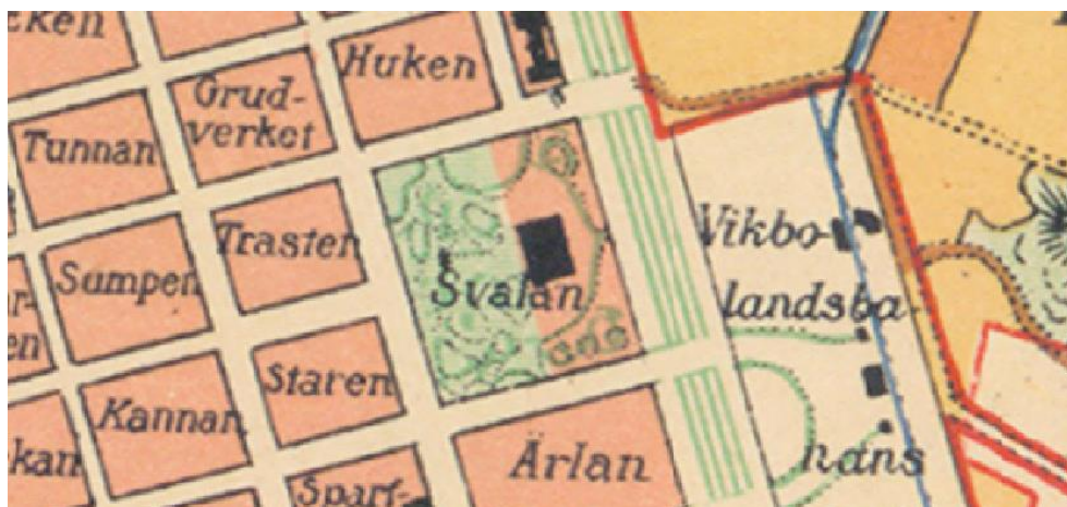
Figur 2: Karta från 1908 som visar kvarteret Svalan med Djäkneparken och Oskarsskolan. Karta: Norrköpings kommun.

När Oskarsskolan byggdes anlade man samtidigt den omkringliggande Djäkneparken, formgiven antingen av Carl Malm eller av stadsträdgårdsmästare Axel Widstrand (alternativt i samarbete). Parken fungerade som en skolträdgård där eleverna lärde sig om trädgårdsodling, samtidigt som den gav skolan ett städlat och värdigt utseende som skulle öka barnens trivsel.