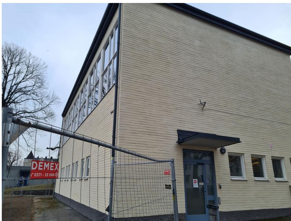
Figur 7: 1962 års gymnastiksal.