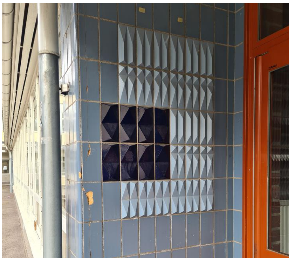
Figur 9: En av fyra väggar med kakelmosaik kring Djäkneparksskolans huvudentréer.