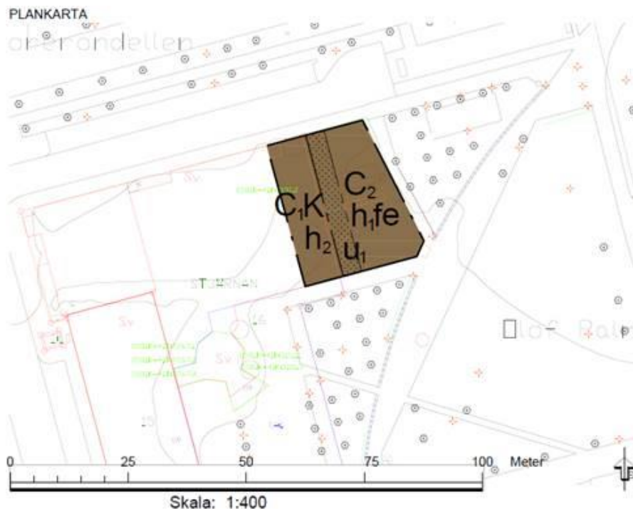
Figur 1. Utkast till plankarta inför samråd daterat 2023-04-06 (Norrköping kommun).

Detaljplaneområdet utgörs av en mindre del av den befintliga byggnaden på fastigheten Stjärnan 16 (område markerat med C 1 K) samt markområde för befintlig uteservering och planerad utbyggnad av denna (u 1 och C 2 ). Uteserveringen ligger på fastigheten Nordantill 1:1. C 1 K medger användning för restaurang och kontor och C 2 uteservering. Utkast till plankarta finns i Figur 1.