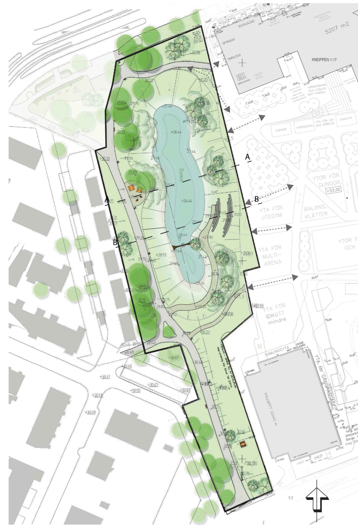
Illustrationsplan över planområdet. Öster om planområdet visas förslag på ny skolbyggnad, idrottshall och skolgård. Illustration: Norrköpings kommun/Norvevo AB.