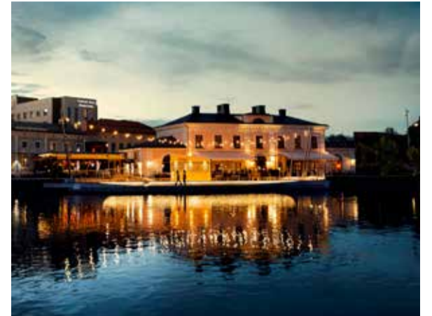
TEXT VICTOR ERIKSSON

Sommaren 2021 slog Tullhuset Seahouse upp portarna i det gamla tullhuset vid Motala ström. 1700-tals byggnaden har rustats upp för att ge plats åt en modern restaurang med plats för möten och evenemang. Gamla Tullhuset tog i fjol hem titeln Årets fasad i byggbranschens stora pris för Sveriges bästa husfasad. Köket är en fusion mellan Asien, Latinamerika och Mellanöstern med en nordisk touch.