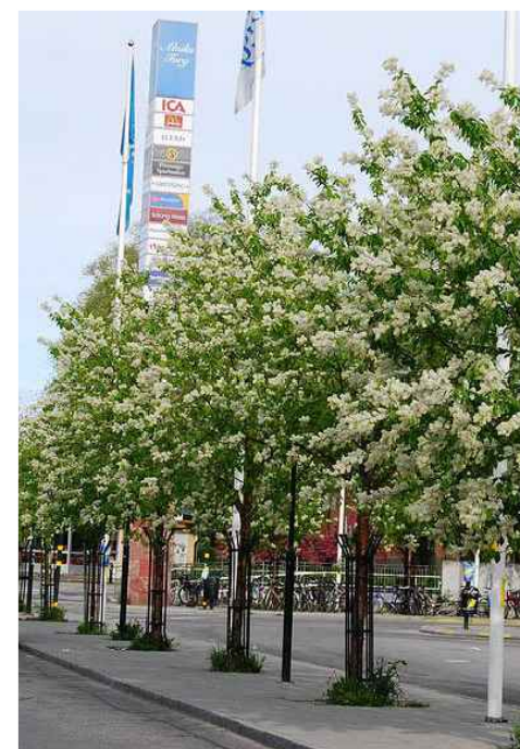
PRUNUS PADUS POESI E