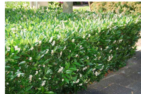
PRUNUS LAUROCERASUS 'OTTO LUYKEN'