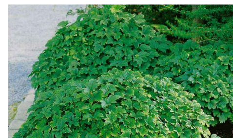
VIBURNUM OPULUS 'NANUM'

LENNINGSKA PARKENS ENTRÉ MÖJLIGGÖR EN NY, GRÖN KOPPLING MELLAN KARLSHEDSPARKEN OCH LENNINGSKA PARKEN. ENTRÉZONEN ÄR SMAL, INKLÄMD MELLAN LENNINGSGATA OCH EN GRUSAD BOLLPLAN. YTAN FUNGERAR FRAMFÖRALLT SOM PASSAGE OCH ENTRÉNS FORMSPRÅK BETONAR ORIENTERBARHET OCH KÄNSLA AV RIKTNING. EN SLINGRANDE LÅG HÄCK FÖLJER FOTGÄNGAREN UTMED HELA ENTRÉNS LÄNGD OCH LANDAR I EN LITEN PLATSBILDNING. EN KURVIG BÄNK PLACERAD I SIKTLINJEN LOCKAR BESÖKAREN IN GENOM ENTRÉN OCH VIDARE UT I LENNINGSKA PARKEN.