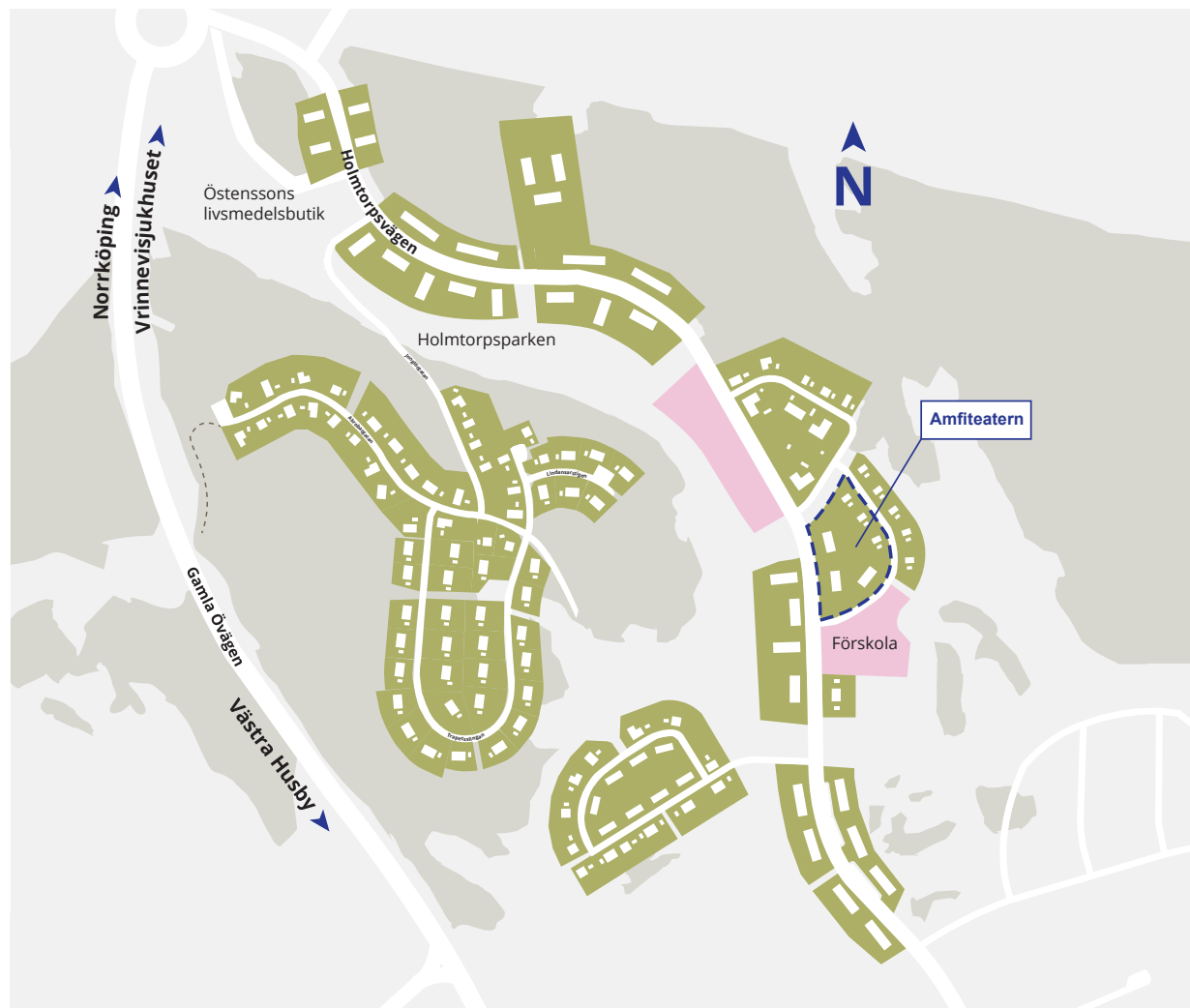
Översiktsskarta Björkalund med kvarteret Amfiteatern utmärkt.

Vrinneviskogens naturreservat och Ensjön i närområdet ger goda möjligheter för rekreation och idrott.