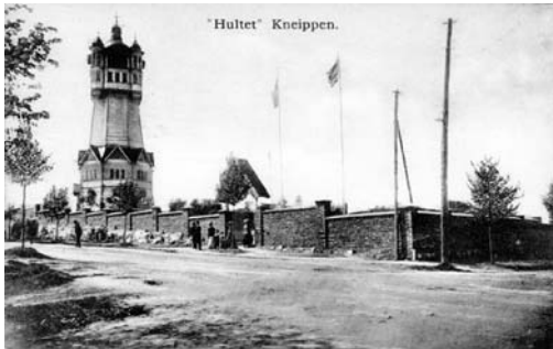
Vy mot tornet från Linköpingsvägen.

Det direkta programområdet har dock inte varit bebyggt innan förskolan uppfördes i slutet av 1980-talet.