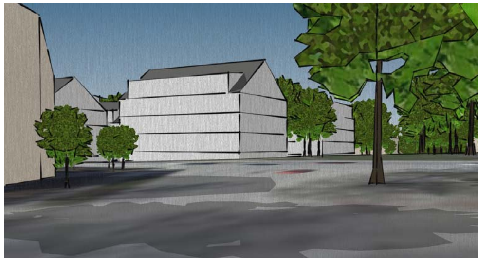
Perspektiv vid Lokegatan generat ur 3D-modell som visar möjliga framtida byggnadsvolymer rakt fram i bilden. Fysisk planering, Martin Heidesjö, mars 2011.