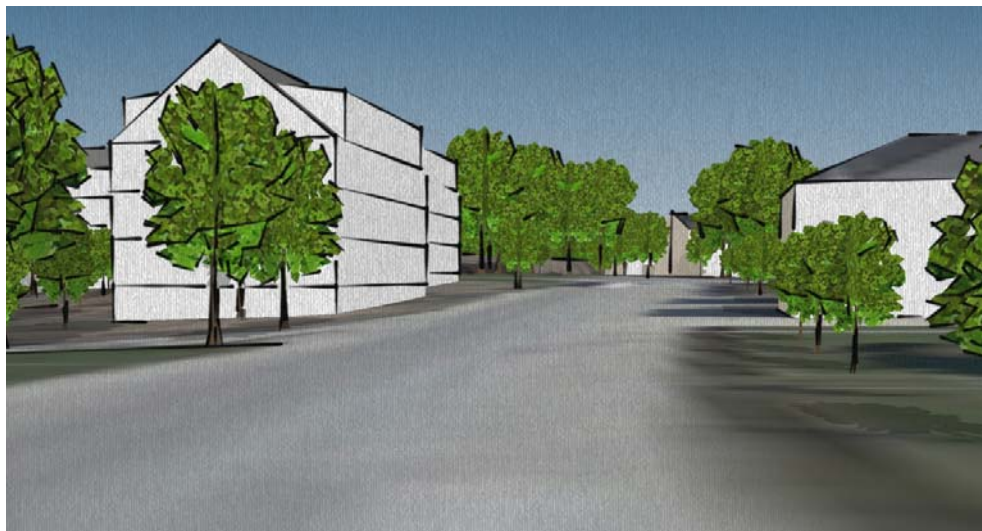
Perspektiv vid Linköpingsvägen generat ur 3D-modell som visar möjliga framtida byggnadsvolymer till vänster i bild. Fysisk planering, Martin Heidesjö, mars 2011.

Arkitektoniskt hittas många olika uttryck i Kneippen. Ett släktskap med den tidiga arkitekturen i Kneippen; jugend och nationalromantik, föreslås. Detta bedöms vara ett bra förhållningssätt till befintlig karaktär samtidigt som det ger möjlighet till att ny arkitektur skapas i samma expressiva anda.