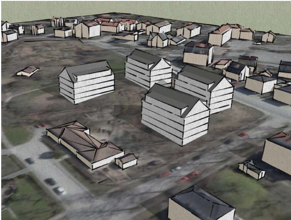
3D-modell över möjliga framtida byggnadsvolymer inom kvarteret Höken. Stadsbyggnadskontoret, Fysisk planering, Martin Heidesjö, mars 2011.