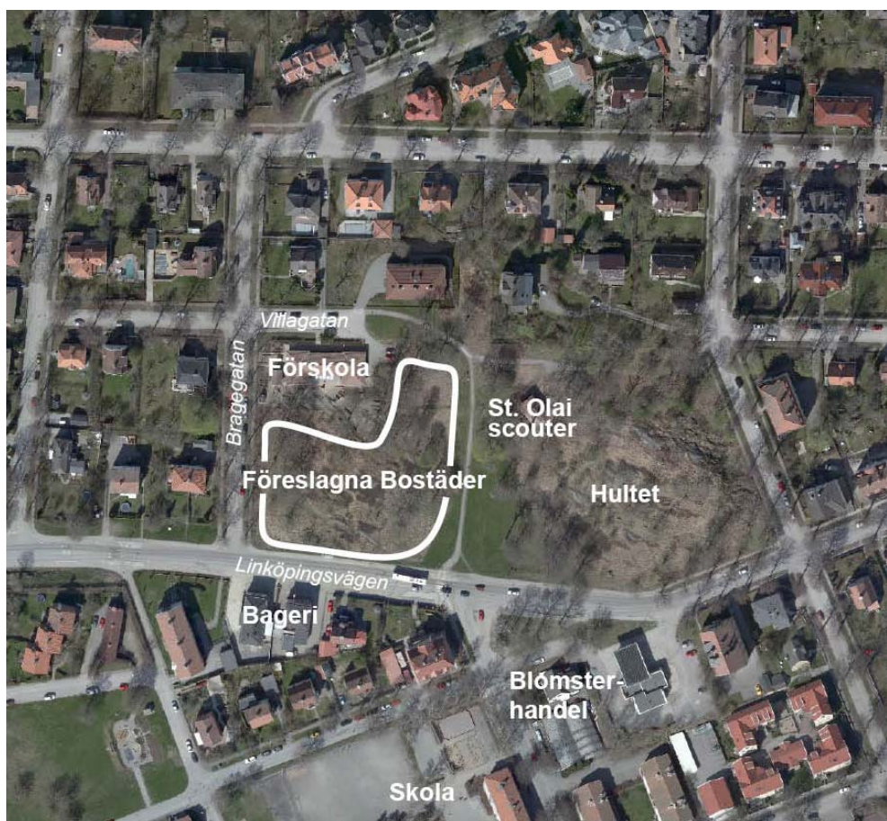
Översiktsbild med en ungefärlig utbredning av föreslagen bebyggelse.

Området omfattar cirka 9 000 m 2 och innehåller en befintlig byggnad vid hörnet Villagatan/Bragegatan, förskolan Hultet. Området sluttar från sydöst mot nordväst – det finns berg i dagen i mitten och ett flertal fullvuxna träd. Ihop med berget Hultet har området en parkliknande karaktär. Vid kanten av berget finns en mindre byggnad där St. Olai scoutkår huserar.