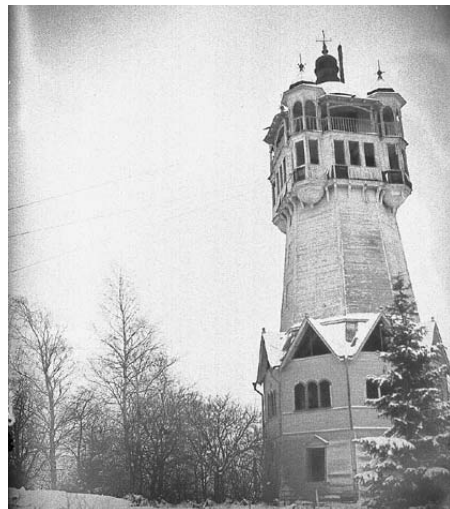
Tornet revs 1935.