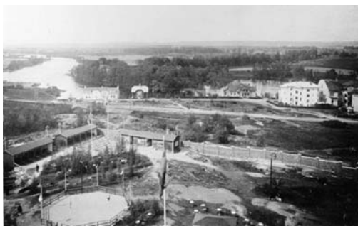
Utsikt från tornet omkring år 1910.