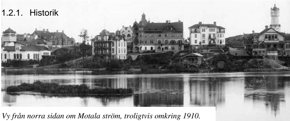
Vy från norra sidan om Motala ström, troligtvis omkring 1910.

Kneippen (tidigare Borgs villastad) påbörjades i slutet av 1890-talet och är stadens första bostadsområde där den egna trädgården spelar en viktig roll. Här växte en högreståndsmiljö fram med trädkantade, breda gator anpassade efter terrängen och stora villor med parkliknande trädgårdar