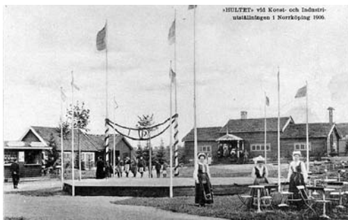
Hultet vid Norrköpingsutställningen 1906.